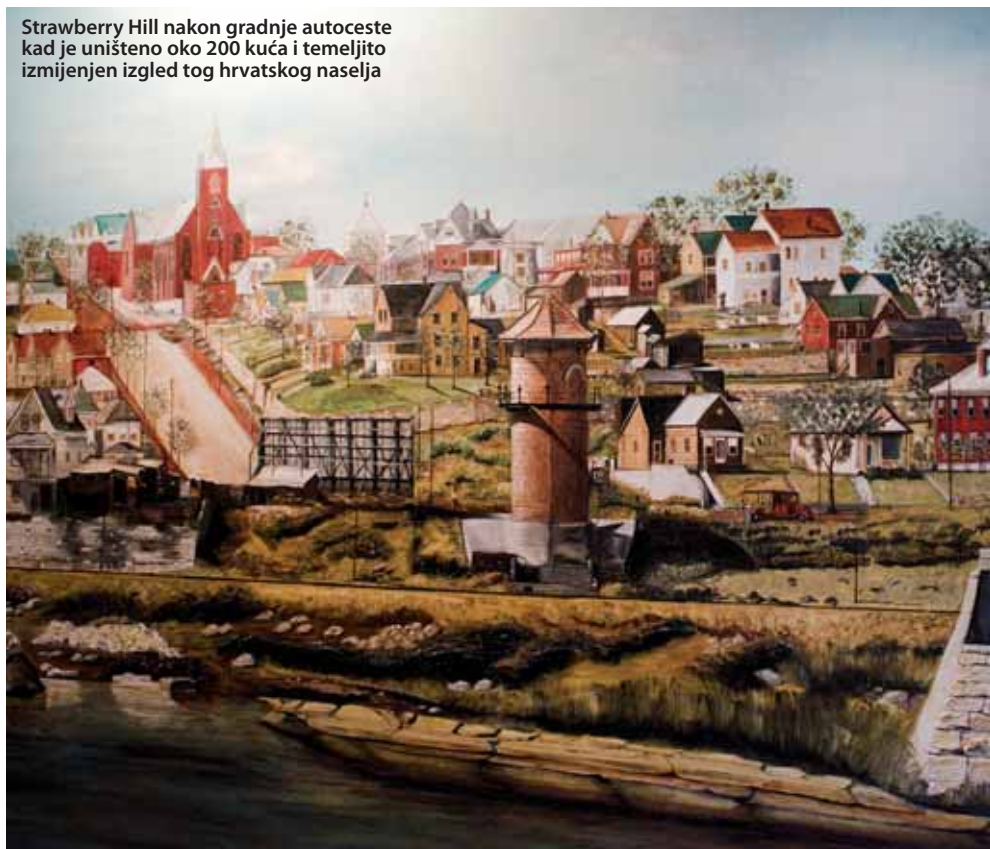
Strawberry Hill nakon gradnje autoceste kad je uništeno oko 200 kuća i temeljito izmijenjen izgled tog hrvatskog naselja