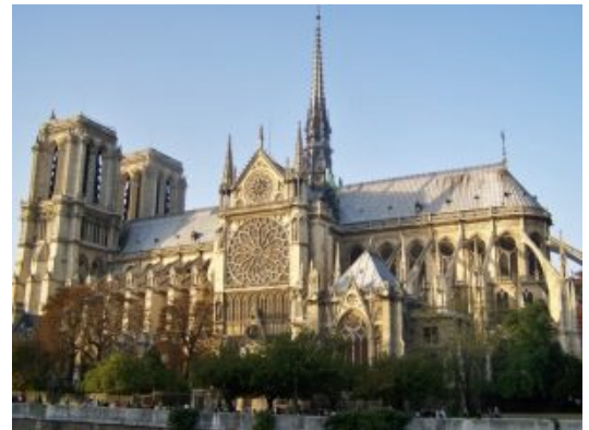
Vue de la cathédrale Notre Dame de Paris, en 2010

à commencer un mouvement de préservation historique de ces lieux culturels. Grâce à cette œuvre, on a fait les rénovations majeures au XIXe siècle.