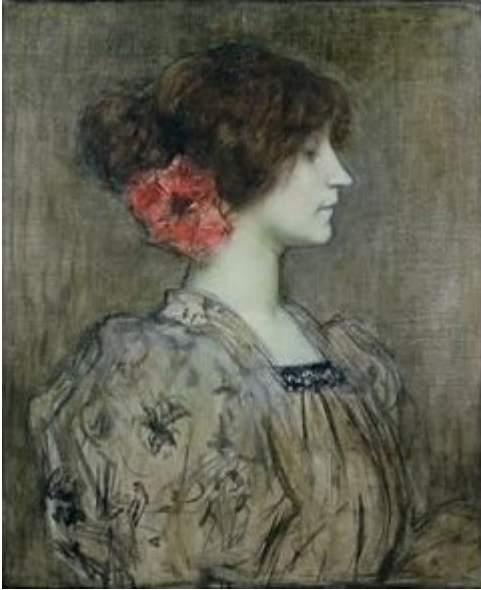
Portrait de Colette

Gabrielle Colette (1873-1954) a reçu une éducation laïque et a lu les grands classiques et a étudié le français et le style avec son père. Elle s'est mariée à un auteur populaire de romans Willy. Il l'a encouragée à écrire et en 1895, on a publié son premier roman Claudine à l'école , une œuvre semi-autobiographique sous le nom de Willy. Elle l'a suivi avec d'autres histoires de Claudine. Plus tard elle est devenue mime, puis actrice à Paris et ensuite journaliste. En même temps elle a continué à publier un roman presque chaque année. En 2018, un film de sa vie est sorti, dont la vedette est Keira Knightley.