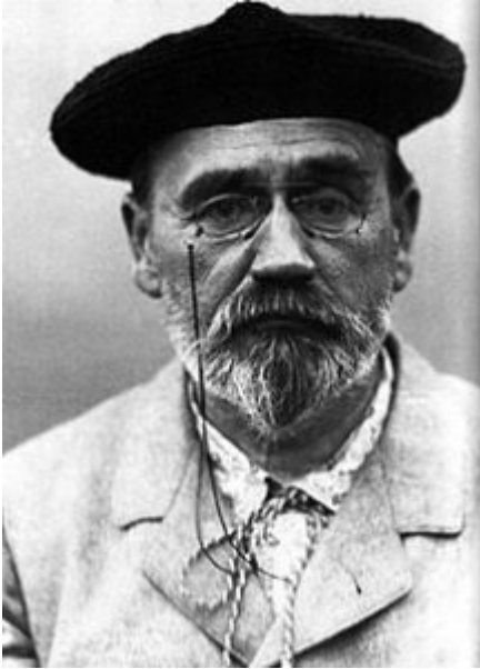
Autoportrait d'Émile Zola

Émile Zola était écrivain et journaliste français, né le 2 avril 1840 à Paris, où il est mort le 29 septembre 1902. Considéré comme le chef de file du naturalisme, c'est l'un des romanciers français les plus populaires, les plus publiés, traduits et commentés au monde.