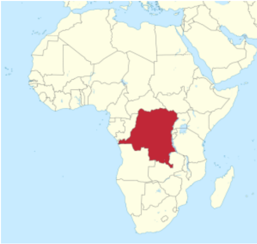
La République démocratique du Congo en Afrique

La République démocratique du Congo (RDC) est un pays d'Afrique centrale. C'est le quatrième pays le plus peuplé d'Afrique ainsi que le pays francophone le plus peuplé.