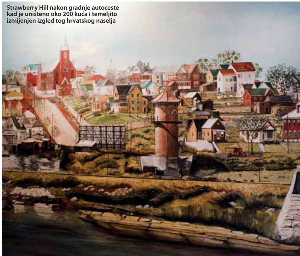
Strawberry Hill nakon gradnje autoceste kad je uništeno oko 200 kuća i temeljito izmijenjen izgled tog hrvatskog naselja