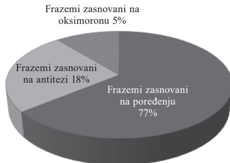
Slika 2: Procentualni prikaz brojnosti frazema nastalih semantičkom transpozicijom putem semantičkih figura u užem smislu